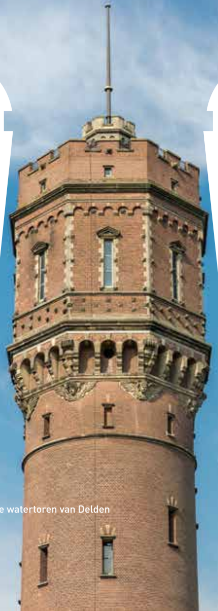
De watertoren van Delden

‘Dan komt er zo’n Quote-500-figuur die er een woning van maakt waar hij twee keer per jaar zijn vrienden uitnodigt en dan heeft de buurt er niets meer aan’