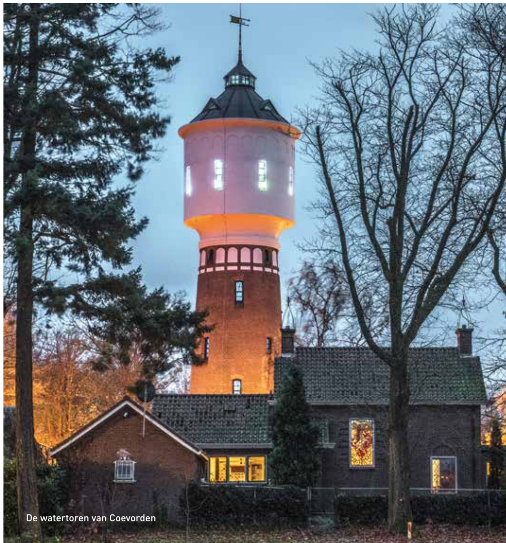
De watertoren van Coevorden

in rap tempo buiten werking gesteld. Hoeveel er nog in functie zijn, kan Van der Veen niet met zekerheid zeggen. Volgens de database op de NWS-website, waarin de stichting de status van elke toren nauwgezet bijhoudt, zijn het er 41. "Maar soms horen we dat een toren al buiten gebruik is, terwijl wij dachten dat hij nog functioneerde. Het is nogal dynamisch."